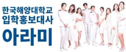
아라미 공식 유튜브 채널 메인 프로필