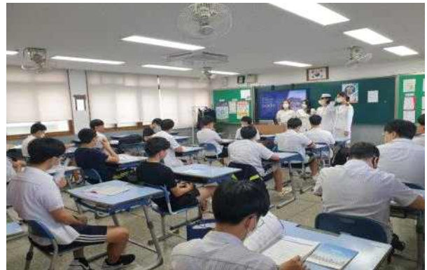
고교 방문 입학설명회 현장