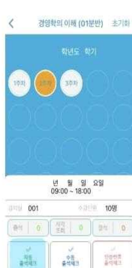
3) 자동 출석체크 시작