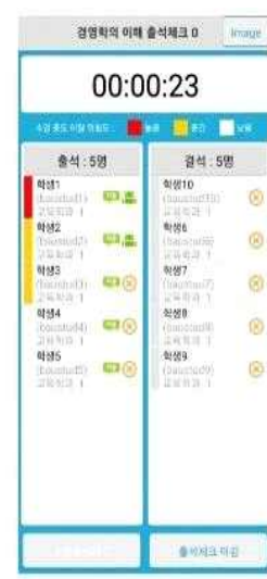
4) 수업 중도 이탈 위험도 확인