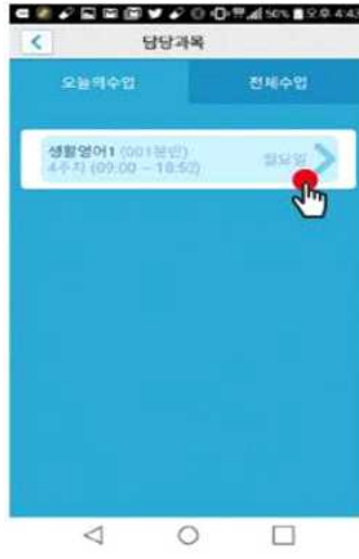
2) 과목 선택