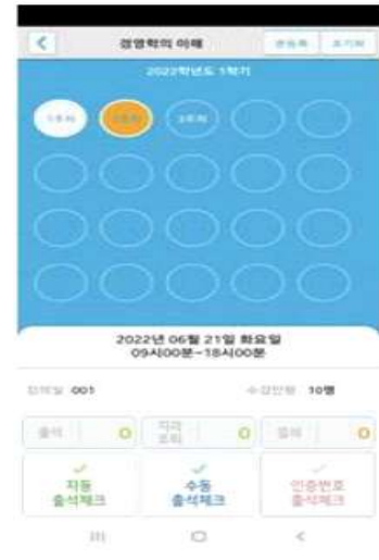
3) 출석체크 시작